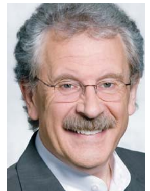
Heinrich Aller, Landtagsabgeordneter aus Seelze. Von 1998 bis 2003 Niedersächsischer Finanzminister

Wir Sozialdemokraten stehen für eine kluge Konsolidierungspolitik. Auf dem Weg aus der Krise brauchen wir einen intelligenten Mix aus Sparen und Investitionen in die Zukunft. Grundlage dafür ist: Klarheit und Wahrheit im Landeshaushalt. ■