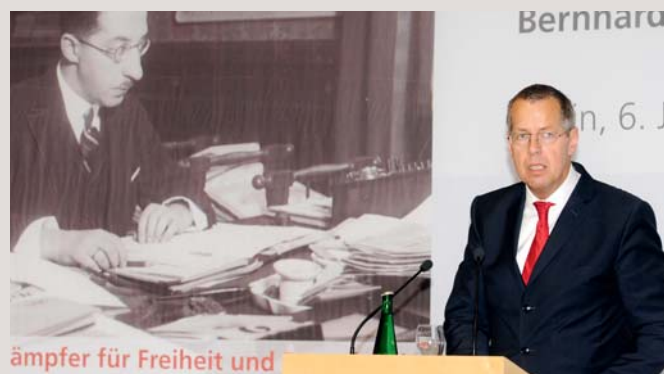
ämpfer für Freiheit und