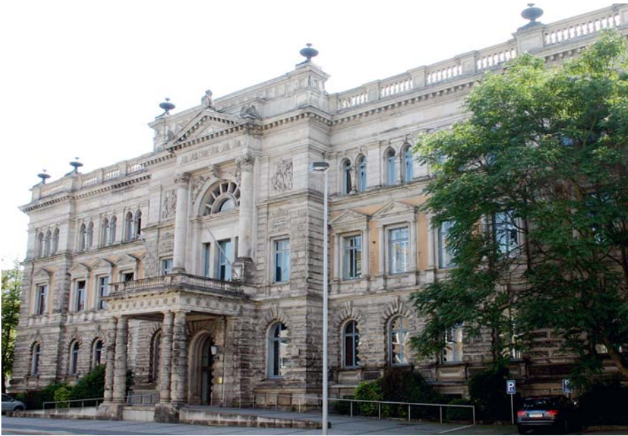
Feudaler Palast für fatale Politik: Das Niedersächsische Finanzministerium in Hannover.

Es hätte doch so schön werden können: Seit der Landtagswahl 2003 präsentieren sich Ministerpräsident Christian Wulff und seine CDU/FDP-Landesregierung als scheinbar seriöse Haushaltssanierer. Die SPD sollte dauerhaft in die Ecke gestellt werden – die Sozis könnten nicht mit Geld umgehen. Jetzt hat Wulff ein Problem: Die Legende vom Sanierer Wulff findet ihr jähes Ende. Seine Landesregierung verantwortet nicht nur eine fatale Haushalts- und Finanzpolitik. CDU und FDP werden auch zu den größten Schuldenmachern der Landesgeschichte. Die Finanz- und Wirtschaftskrise schlägt auf den Landeshaushalt durch. Bewiesen ist, wie eng Wirtschafts- und Haushaltslage zusammenhängen – ähnlich wie in 2001/2002.