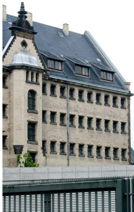
Symbol für alte Knastzeiten: Der frühere Zellen-trakt der Hannoverschen Polizei-Direktion.

Im Landeshaushalt stehen 270 Millionen Euro für Bremervörde zur Verfügung. Geld, das an anderer Stelle dringend benötigt wird. In den Justizvollzugsanstalten besteht ein enormer Sanierungsbedarf, um menschenwürdige Haftbedingungen herzustellen.