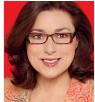
WK 37 | Harburg Monika Griefahn Bürgerbüro Brauhofstraße 1 21423 Winsen (Luhe) Telefon 04171.780171 monika.griefahn@wk.bundestag.de www.monika-griefahn.de