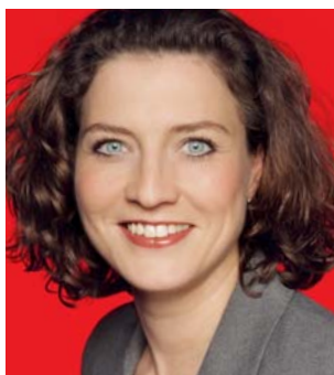
WK 51 | Braunschweig Dr. Carola Reimann Schloßstraße 8 38100 Braunschweig Telefon 0531.4809822 carola.reimann@bundestag.de www.carola-reimann.de