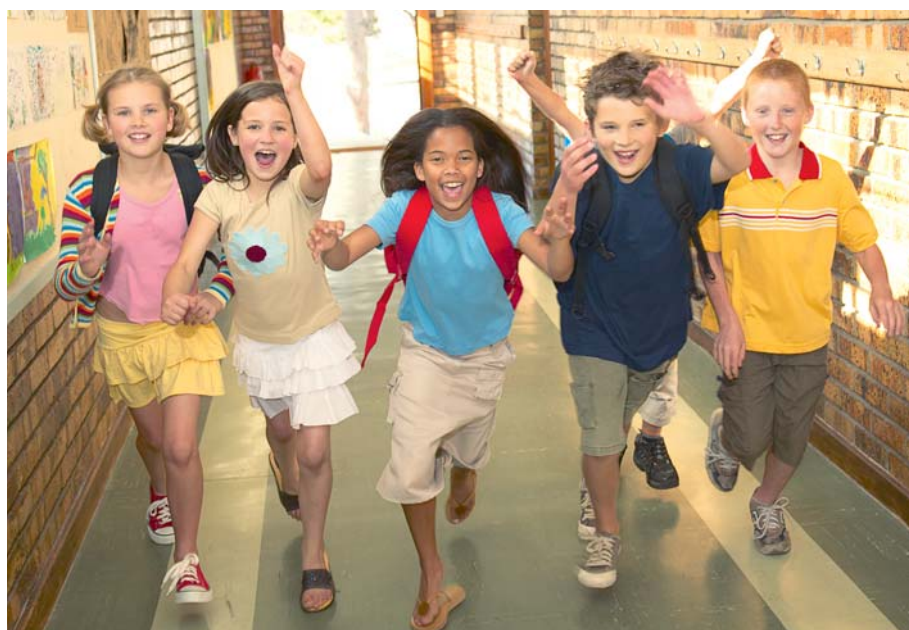
Wirksamer Kinderschutz unterstützt Kinder und bringt sie vorwärts.

Die SPD fordert seit langem ein Präventionsgesetz, mit dem benachteiligte Familien und ihre Kinder besser erreicht werden können. Prävention und Gesundheitsförderung müssen stärker in den Lebenswelten der Familien – zum Beispiel im Kindergarten, in der Schule, im