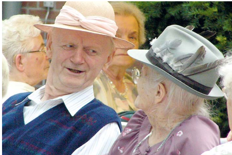
Nicht nur für die Generation 60plus von Bedeutung: Das Recht auf die individuelle Patientenverfügung.