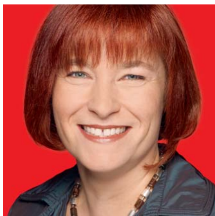
Caren Marks ist familienpolitische Sprecherin der SPD-Bundestagsfraktion.

Der Deutsche Bundestag im Sommer 2009: ein Gesetzentwurf des Bundesfamilienministeriums soll Kinder besser schützen, fällt aber in der öffentlichen Ausschussanhörung und in Stellungnahmen durch. Eine Zeitung titelt »Von der Leyens Scheitern – Kinderschadensgesetz«.