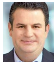
WAHLKREIS 45 Hubertus Heil