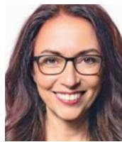
WAHLKREIS 42 Yasmin Fahimi