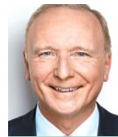
WAHLKREIS 48 Bernd Westphal