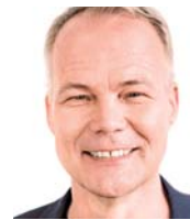
WAHLKREIS 47 Dr. Matthias Miersch