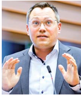
Tiemo Wölken im Europäischen Parlament