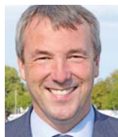
WAHLKREIS 24 Johann Saathoff