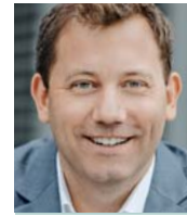
WAHLKREIS 35 Lars Klingbeil