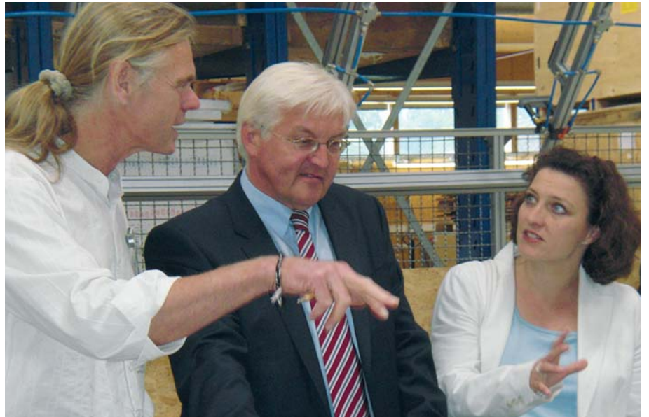
Im Rahmen seiner Sommerreise machte SPD-Kanzlerkandidat Frank-Walter Steinmeier in Braunschweig Station. Zusammen mit Carola Reimann, im Team Steinmeier zuständig für den Bereich Forschung, besuchte er die Braunschweiger Firma Solvis, einen der Pioniere der Solarwirtschaft in Deutschland.

Noch ein Feld staatlichen Handelns: Gegenwärtig lassen viele Banken vor allem den Mittelstand im Stich. Die Kredite klemmen, weil Banken über vorsichtig sind oder unternehmensfremde Spielchen treiben. Das Land muss deshalb über die Landesbank als Partner der Sparkassen regulierend