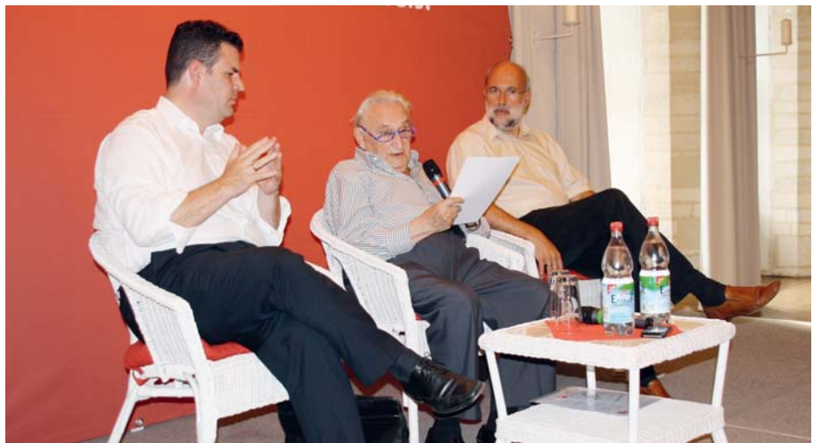
Am Ende erheben sich die 200 Gäste und verabschieden den großen Stra-