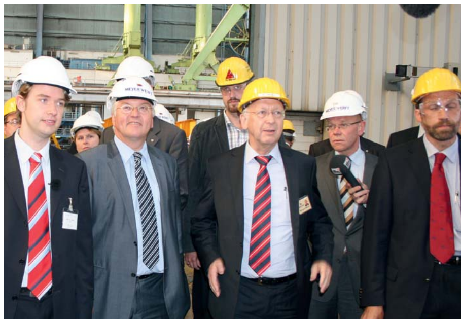
Frank-Walter Steinmeier informierte sich über High-Tech-Schiffbau in der Meyer-Werft in Papenburg