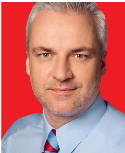
WK 25 | Landkreis Aurich/Stadt Emden Garrelt Duin