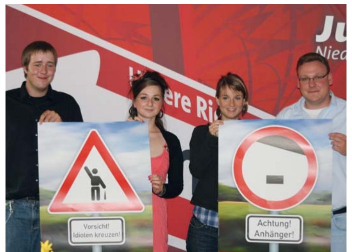
Präsentation der Juso-Plakate gegen Rechtsextremismus.

Schlitte ein Schild mit der Aufschrift »Fassberg bleibt nazifrei« und gab so den Auftakt zur landesweiten Jusoaktion gegen Rechtsextremismus. ■