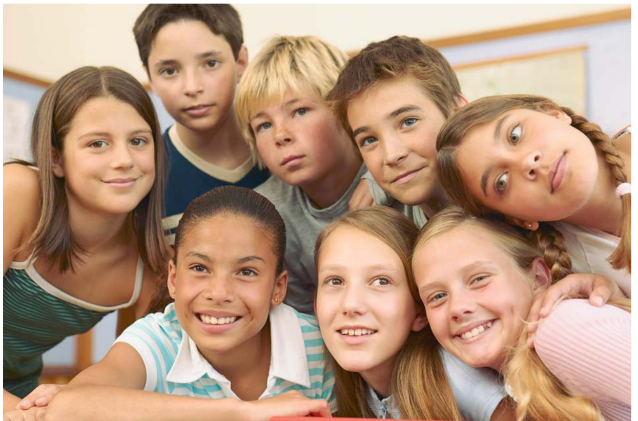
Bunt, vielfältig, laut, fröhlich und gerecht: Die Schule der Zukunft darf niemanden mehr ausschließen.

In diesem Sinn müssen die Schulträger mit ihrem differenzierten Wissen über die sozialen Strukturen in