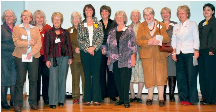
Jubiläums-Netzwerkerinnen für Fraueninteressen.