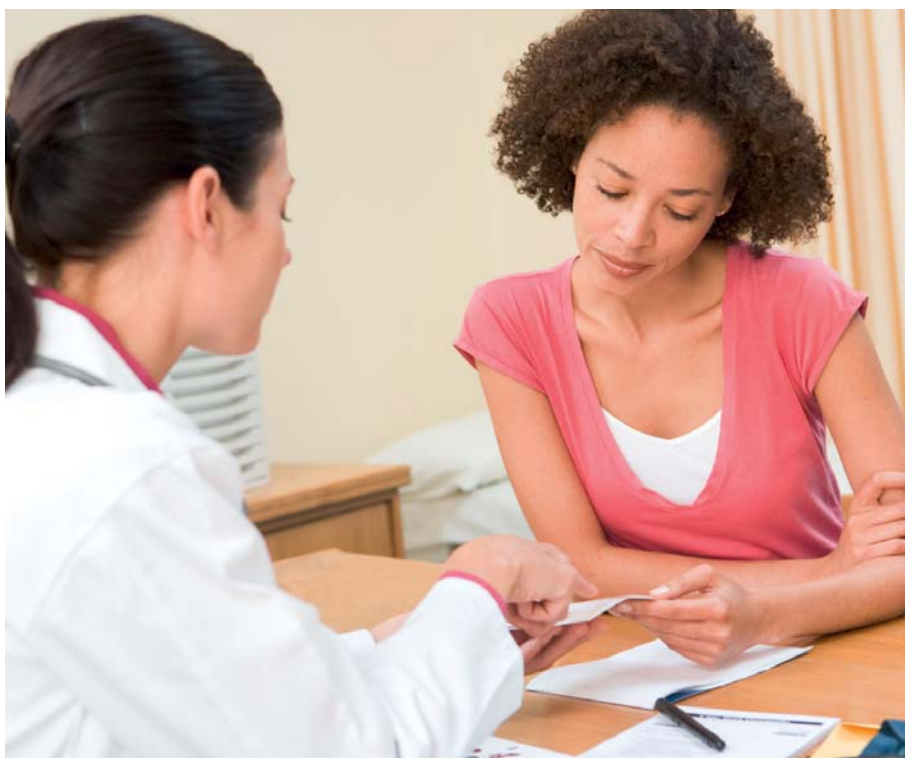
Gesundheitliche Versorgung von Frauen muss weiter verbessert werden.

Aktuell gilt es z. B., die gesundheitliche Versorgung von Frauen, die von häuslicher Gewalt betroffen sind, sicherzustellen. So erkennen AllgemeinärztInnen, ZahnärztInnen oder das Personal in Krankenhäusern häufig nicht, dass Gewalt vorliegt. Die Forderungen hier sind: Schulungen zum Thema, die Verletzungen gerichtsverwertbar dokumentieren und kompetent an spezielle Bera-