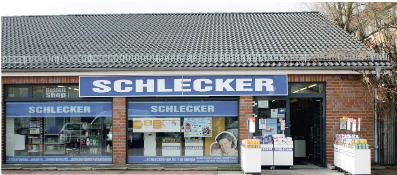
Wie geht es weiter für die Beschäftigten bei Schleckers?