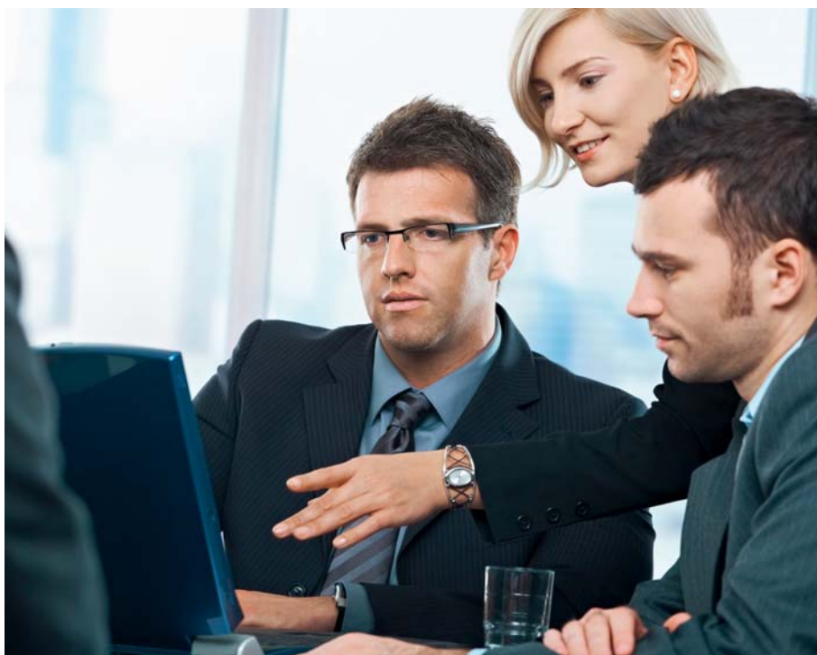
Gleiches Geld für gleiche Arbeit von Frauen und Männer ist noch immer keine Selbstverständlichkeit.

Die immer noch anhaltende Diskussion um die Geschlechterquote in Deutschland ist peinlich. In jeder Organisation, in jedem Land, in dem eine Quote eingeführt worden ist, hat sie sich als positive Einflussgröße bewährt. In Deutschland gibt es kaum ein Gremium, in dem es nicht Minderheitsmandate gibt. Mandate für Jugend, Mandate für spezifische Berufsgruppen, Mandate für politische Parteien usw. Niemand diskutiert über diese Mandate. Die Tatsache, dass die Mehrheit dieser Gesellschaft nicht ansatzweise repräsentativ in den politischen und wirtschaftlichen Machtzentren verankert ist, ist aber keine Frage von Mandaten. Eine echte Quote muss her, um Chancengleichheit herzustellen, wo sie von alleine nicht gewachsen ist. Freiwillige Selbstverpflichtung hin oder her. Und, liebe Frauen, lasst Euch nicht einreden, dass Eure