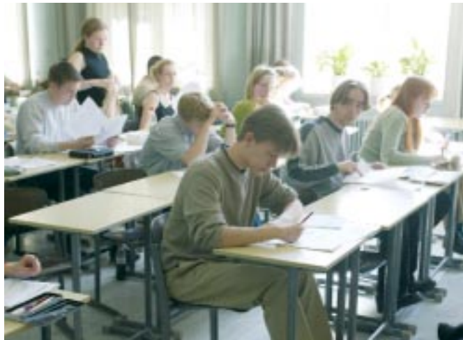
SPD-Bildungsziel: Die beste Bildung für alle!

Die Chancen eines jeden Menschen werden ganz wesentlich in den ersten Lebensjahren beeinflusst. Hier wird der Grundstein für den weiteren Bildungsweg gelegt. In dieser wichtigen Lernphase setzt unser Bildungskonzept an. Kinder sollen erfolgreich starten! Mit zunächst 50 Familien-