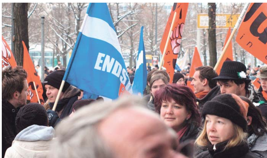
Niedersächsische Jusos bei der Anti-Nazi-Demo in Dresden am 13. Februar 2010.

Gut 65 Jahre nach der Befreiung vom deutschen Faschismus wollen Neonazis durch Dresden marschieren und an den sogenannten »Bombenholocaust« erinnern.