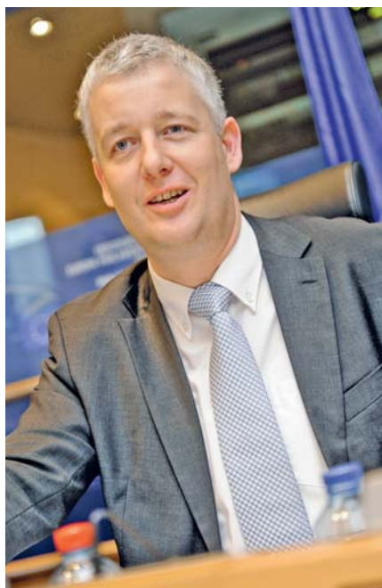
Matthias Groote MdEP

Matthias Groote nimmt sich für die kommenden zweieinhalb Jahre bis zur