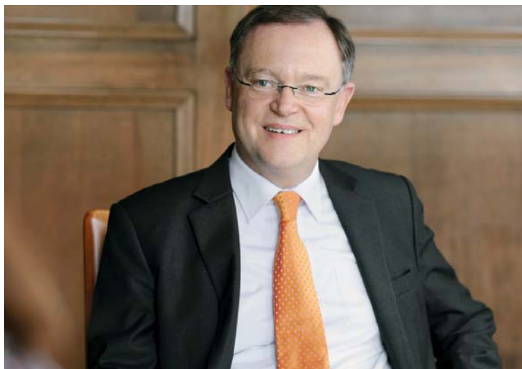
Stephan Weil im Gespräch.

Vorwärts: Herzlichen Glückwunsch zur Wahl zum Landesvorsitzenden der SPD Niedersachsen! Worin siehst du nun deine wichtigsten Aufgaben im neuen Amt?