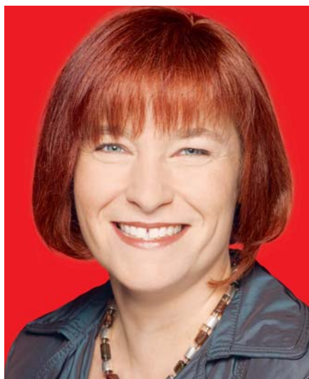
Caren Marks MdB