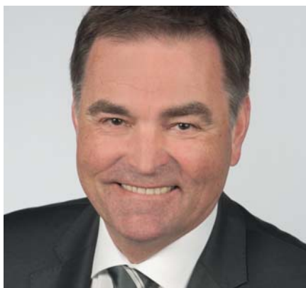
RÜDIGER BUTTE Landrat für den Landkreis Hameln-Pyrmont

»Ich werde weiterhin als Landrat mit gradliniger, offener und ehrlicher Politik für die Menschen in Hameln-Pyrmont arbeiten. Dafür stehe ich.« www.ruediger-butte.de