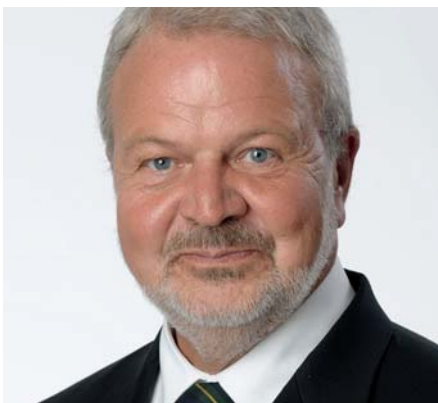
HELMUT HOLZAPFEL Bürgermeister für die Samtgemeinde Papenteich

»Mit der Aussage ›Die Menschen im Mittelpunkt‹ bewerbe ich mich bei den Papenteicher Bürgerinnen und Bürgern erneut um ihr Vertrauen.« www.helmut-holzapfel.de