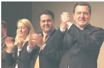
Ließ sich feiern: Der Kanzler