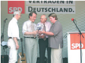
Inselurlauber Franz Müntefering beim Weser-Ems-Wahlkampf

Die Zusammenlegung von Arbeitslosenhilfe und Sozialhilfe war ein schmerzhafter Prozess; aber er brachte den Langzeitar-