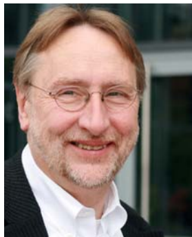
Bernd Lange, MdEP