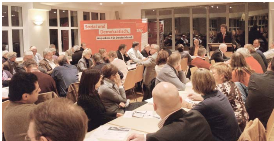
Großes Interesse: Viele Zuhörer bei der Info-Veranstaltung in Braunschweig.

Der Braunschweiger Landtagsabgeordnete unterstützt die Unterschriftenaktion von »Mehr Demokratie e.V.«. Er rief die Gäste beider Abendveranstaltungen des SPD-Bezirks dazu auf, für die Aktion zu werben. Außerdem versprach Bachmann den Anwesenden, dass eine SPD-geführte Landesregierung nach der Landtagswahl 2013 die schwarz-gelben Beschlüsse wieder kassieren wird. ■