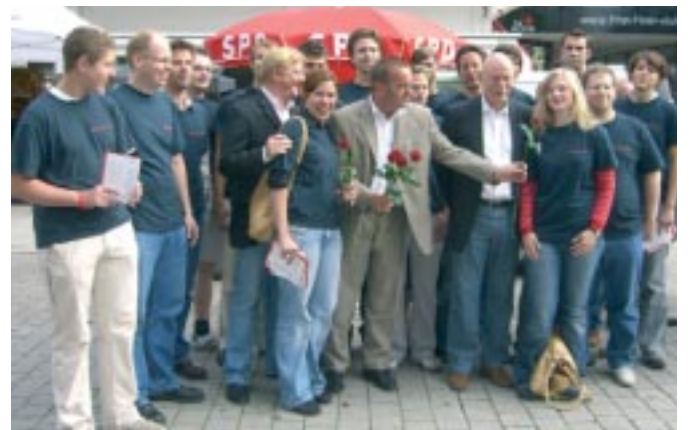
Peter Struck, Martin Schwanholz und Boris Pistorius mit dem Jungen Wahlkampfteam zur Oberbürgermeisterwahl 2006 in Osnabrück

Der neue Oberbürgermeister von Osnabrück Boris Pistorius konnte auf die zahlreichen fleißigen Hände und klugen Köpfe seines Jungen Wahlkampfteams zurückgreifen. Diese hatten im letzten Jahr bereits, als vom Willy-Brandt-Haus ausgezeichnetes Team die »No Angies«, MdB Dr. Martin Schwanholz tatkräftig und erfolgreich unterstützt.