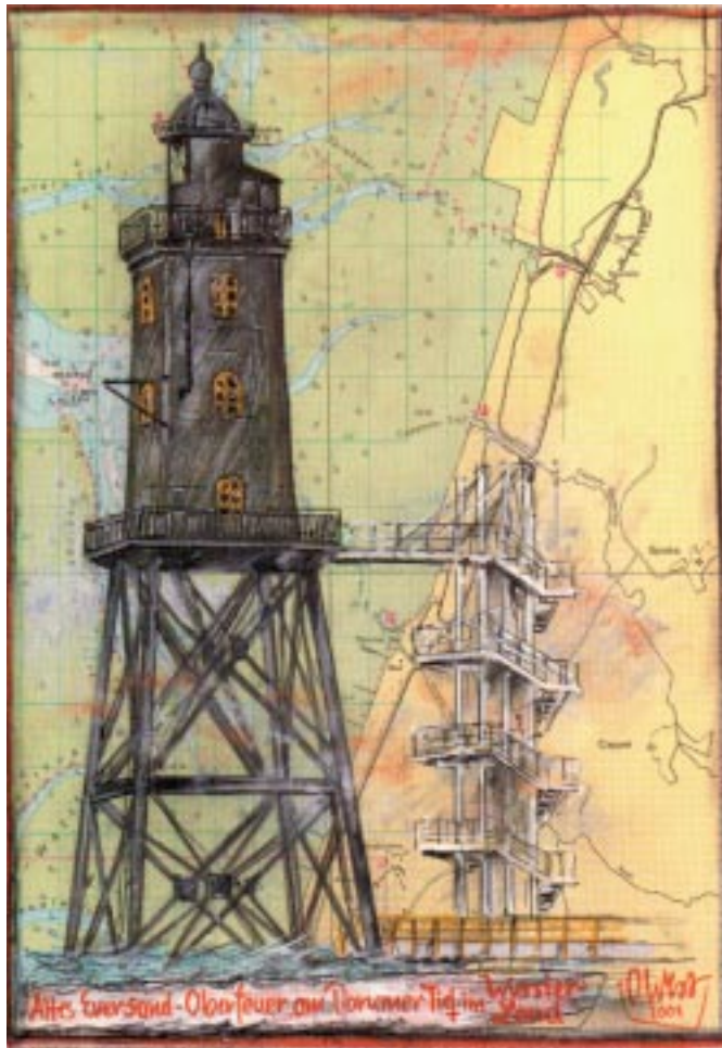
Eversand - Oberfeuer im Land Wursten.

Der Rezensent empfiehlt zum Einstieg einen