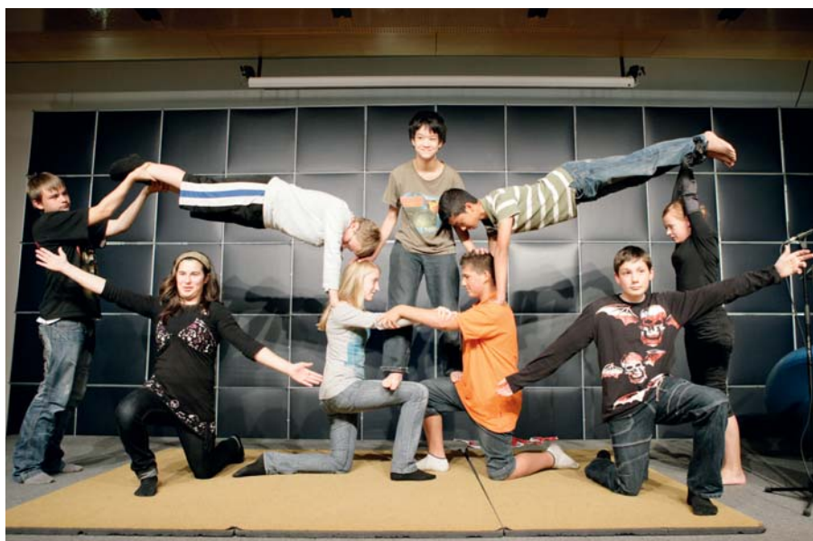
Erfolg ist ein Gemeinschaftsprodukt. Die Akrobatik-Gruppe der IGS Linden.

Weiterhin viel Erfolg wünscht der Niedersachsen-vorwärts und fragt: Wie lange noch eigentlich wollen sich Wulff und Co. gegen das integrierte Schulsystem sperren? ■