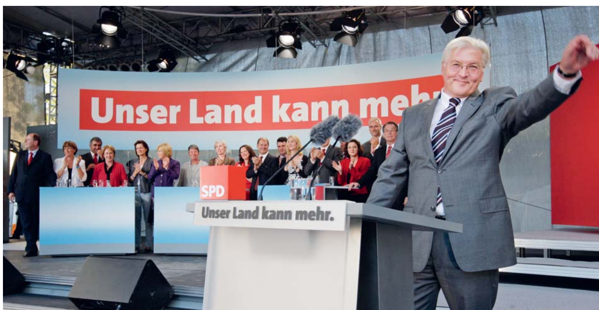
Stark für Deutschland und stark für Europa: Frank-Walter Steinmeier und sein Kompetenz-Team auf dem Opernplatz in Hannover am 31. August 2009.

Die Europäische Union ist auf einem sehr guten Weg und wird durch den Vertrag von Lissabon einen sehr entscheidenden Schritt vorankommen. Die Kritik des Bundesverfassungsgerichts ist in einigen Teilen nicht nachvollziehbar, zumal es doch sehr verwundert, dass es als einziges Europäisches Gericht bislang noch keine Vorabentscheidung beim Europäischen Gerichtshof eingeholt hat.