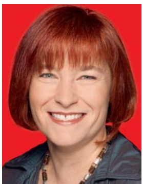
Caren Marks ist familienpolitische Sprecherin der SPD-Bundestagsfraktion.