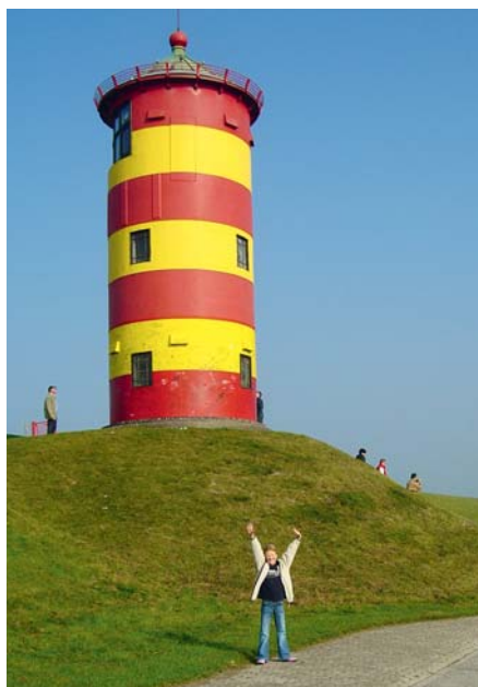
Bekanntes Wahrzeichen der Nordseeküste: Der Pilsener Leuchtturm.

Vorrangig muss die Einrichtung eines eigenen Unterausschusses Tourismus durch den Niedersächsischen Landtag sein. Die Landespolitik sollte darauf achten, dass die verschiedenen Fachinteressen nicht mit der Tourismuswirtschaft kollidieren wie etwa die Sommerferienregelung. Der Tou-