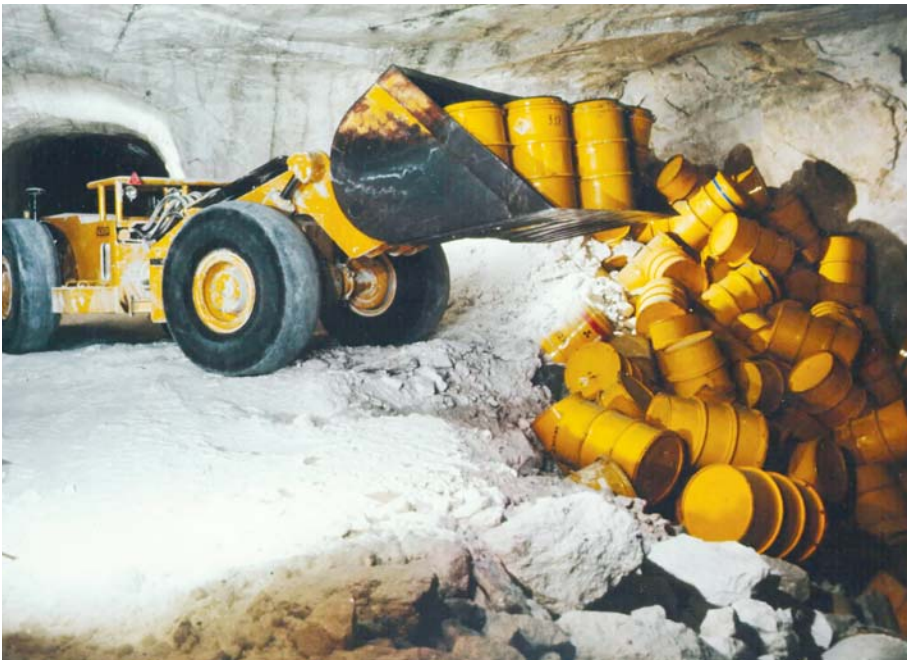
Atomare Versuchsendlagerung im suspenden Salz