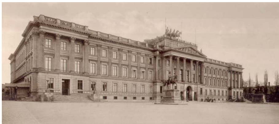
Das Königliche Residenzschloss in Braunschweig 1893.

Sozialdemokratinnen und Sozialdemokraten haben das Schloss immer mit Argwohn betrachtet, selbst als es schon seit Jahrzehnten verschwunden war. Nachdem die feudalen Herren 1918 vom Arbeiter- und Soldatenrat verjagt worden waren, gelang es bis 1933 nicht, das Schloss