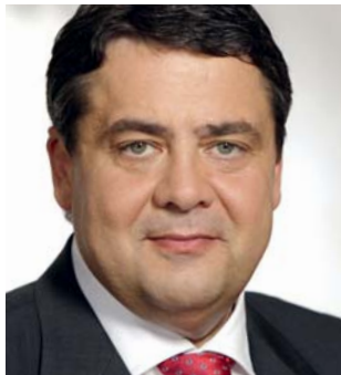
WK 50 | Salzgitter – Wolfenbüttel – Vorharz Sigmar Gabriel Büro WF: Bahnhof 1c, Tel. 05331-904208, sigmar.gabriel@wk.bundestag.de Büro SZ: A.d.Windmühle 2b, Tel. 05341-8598846, sigmar.gabriel.lt@bundestag.de Büro GS: Bäckerstraße 23/24, Tel. 05321-709817, sigmar.gabriel@wk2.bundestag.de www.sigmar-gabriel.de