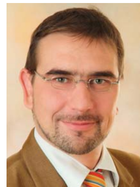
Sven Ambrosy (SPD) ist Vorsitzender des Tourismusverbandes Niedersachsen e.V. und Landrat des Landkreises Friesland

Niedersachsen verfügt über enorme Entwicklungspotenziale. Kein anderes Bundesland kann eine solche Vielfalt an Schönheit und Angeboten vorweisen. Damit sollten wir selbstbewusst auftreten: Weg mit der Bescheidenheit! ■