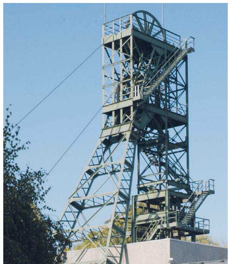
Salzbergwerk Asse: Einfahrt in's strahlende Chaos