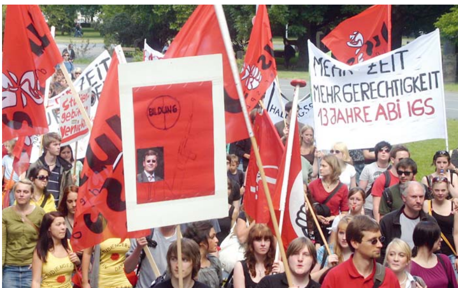
Farbig und phantasievoll gegen das Bildungssystem der Kaiserzeit.