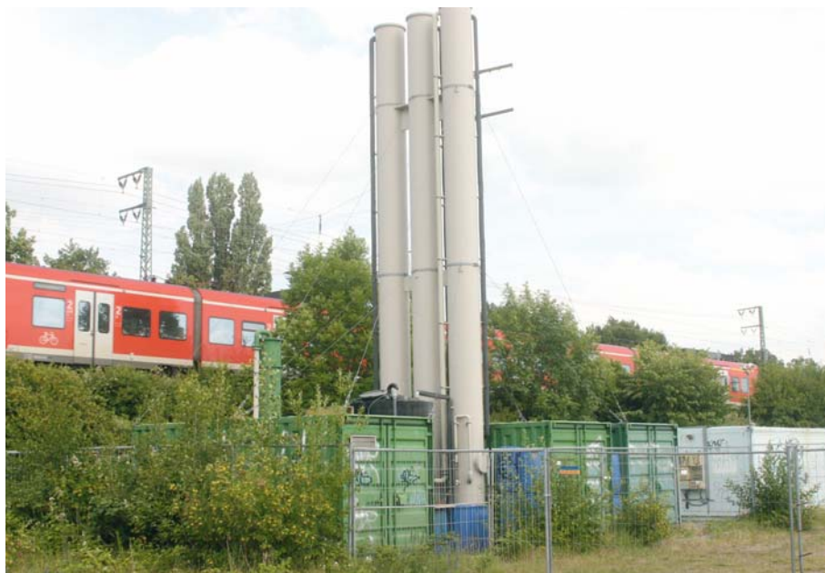
Dauerhafter Problemfall: Auch nach Jahren der Sanierung ist die Industribrache des ehemaligen Südbahnhofs in Hannover weiterhin belastet.

Insbesondere der federführende Fachminister Sander hat lange Zeit jedweden Handlungsbedarf negiert und sich hinter Förderrichtlinien der EU verschanzte. Redlich ist das nicht, weiß der Minister doch sehr genau, dass die fragliche Richtlinie lediglich bei einer freiwilligen Sanierung zur Wiederherstellung von Gewerbeflächen greift. In den zahlreichen Fällen, in denen die Bodenschutzbehörden eine Sanierung anordnen müssen, ohne dass noch ein leistungsfähiger Verursacher der Altlast herangezogen werden könnte, laufen die europäischen Bestimmungen hingegen ins Leere. In aller Regel bleiben die Kosten dann an den Kommunen oder den privaten Grundstückseigentümern hängen.