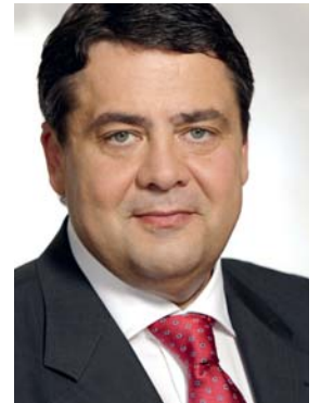
Sigmar Gabriel, Bundesminister für Umwelt, Naturschutz und Reaktorsicherheit

Wir müssen aus dem Asse-Debakel lernen: Wer jetzt immer noch Atomkraft als »Bioenergie« verniedlicht und die alten Atomkraftwerke länger laufen lassen will, handelt schlicht verantwortungslos. ■