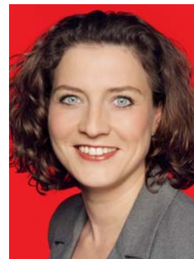
Dr. Carola Reimann aus Braunschweig ist gesundheitspolitische Sprecherin der SPD-Bundestagsfraktion

teren Nachdruck verliehen. Das Urteil hat aber auch eine unmittelbare Bedeutung für die privat Krankenversicherten. Im Interesse der Versicherten ist es wichtig, dass das Verfassungsgericht alle Regelungen der Gesundheitsreform bestätigt hat, die vor allem den Versicherten zu Gute kommen. Sie können einen Basistarif wählen, den jede Private Versicherung anbieten muss. Sie dürfen dort nicht abgewiesen oder mit Risikozuschlägen belegt werden. Sie können erstmals auch zu bezahlbaren Bedingungen die Versicherung wechseln und auch der Bundeszuschuss für versicherungsfremden Leistungen der gesetzlichen Krankenversicherung ist als verfassungskonform bestätigt worden. ■